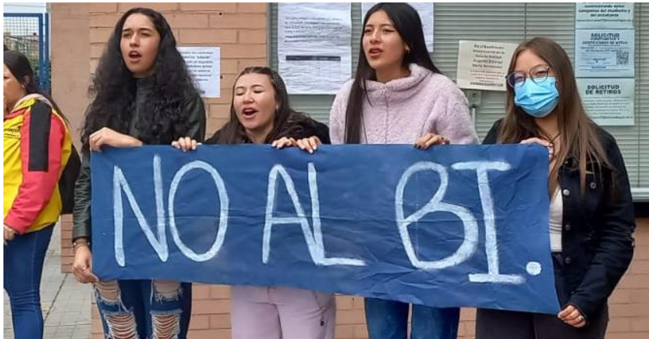
Ilustración 1: Foto tomada el 27 de abril de 2023 en Plantón convocado en la Escuela Normal Montessori

Este texto hace parte de un proceso colectivo e incipiente de investigación y consulta entre docentes que laboran en cuatro de los diez colegios públicos de Bogotá donde se está implementando el programa suizo Bachillerato Internacional . El propósito principal es motivar la reflexión y el debate en el magisterio sobre la implementación de este programa desde una perspectiva crítica. Aquí se describe brevemente la propuesta de Bachillerato Internacional, se presentan algunas reflexiones frente a la Resolución 2798 de 2022, se aborda el proceso de socialización de este programa desde la Secretaría de Educación Distrital, se analizan algunos datos de otros países donde ya se implementó, se reflexiona sobre las condiciones laborales de los docentes, se analizan los presupuestos destinados, se cuestiona el objetivo principal del BI (cierre de brechas) y se plantean algunas contradicciones detectadas frente al proceso de bilingüismo.